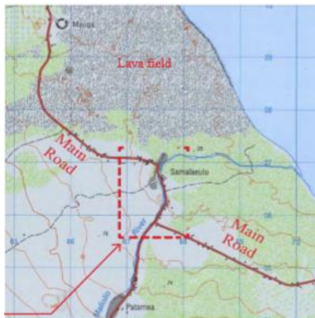
Figure 1 : Key Map

O le vaega o le nofoaga o le poloketi o lo'o fa'amamafa iai le lipoti o le saogalemu o le si'osi'omaga (EIA), o fanua ia o lo'o si'omiaina le nu'u o Samalaeulu ma e I le itu I matuisisifo o Savai'i. O le alafaga o Samalaeulu e tu pe a ma le 3 kilomita mai talafatai ma e pe a ma le 38 mita le mauuluga. O le auala autu o lo'o ta'amilo ia Savai'i e ui mai I totonu o le nu'u o Samalaeulu fa'apea fo'I le vaiatafe o Mali'oli'o. O le vaiatafe lona lua I vaiatafe tetele I savai'I le vaiatafe o Mali'oli'o. O le tele o vaega o le nu'u o Samalaeulu e si'osi'omia e le vaomatua, ma o nisi o vaega ua fa'amama mo fa'atoaga talo ma isi lava mea toto. O le tele o fanua I matu o le nu'u, mai lava I le talafatai e ufitia uma I le papa mai le lava ma e le tele ni mea toto o lo'o ola ai.